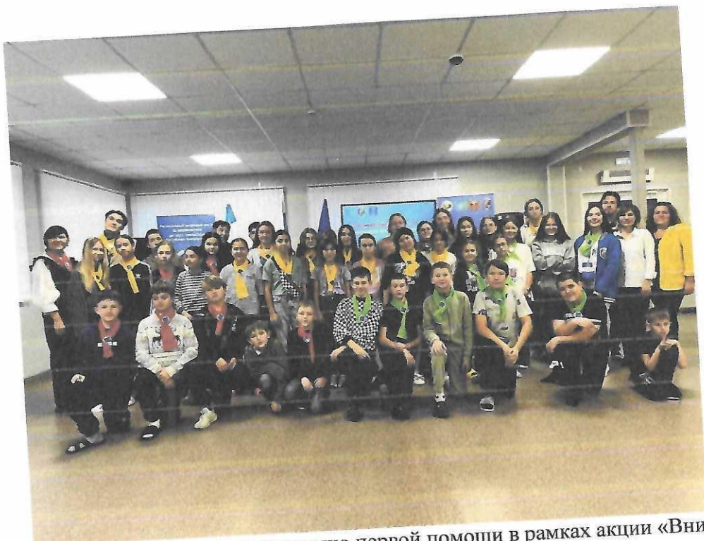
9. Мастер-класс по оказанию первой помощи в рамках акции «Внимание – дети!» https://vk.com/wall-127992313_12936