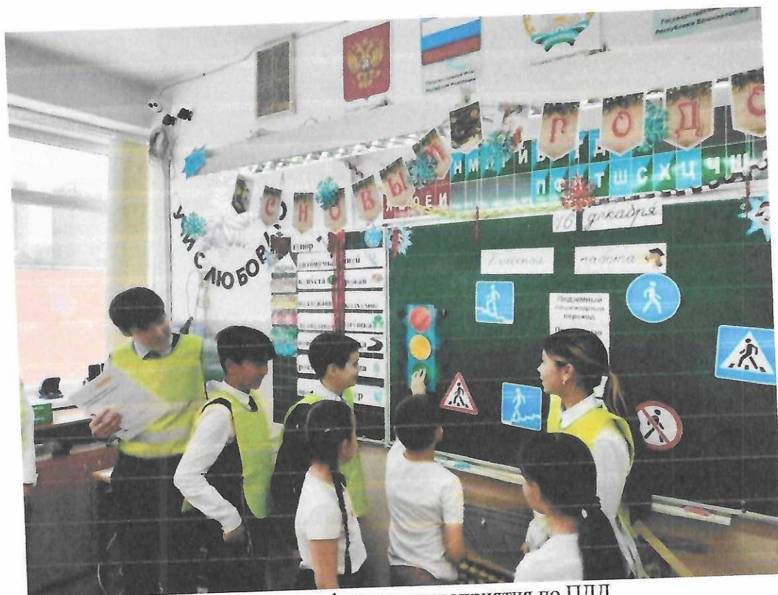
13. Неделя безопасности, профильные мероприятия по ПДД https://vk.com/wall-127992313_13187