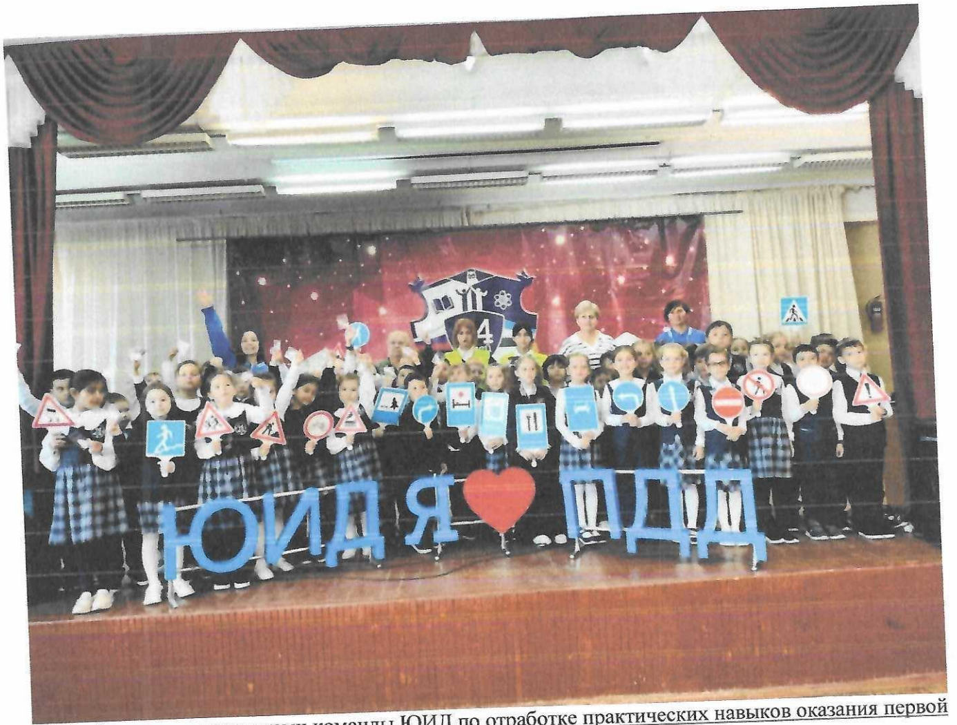
5. Занятие с участниками команды ЮИД по отработке практических навыков оказания первой помощи пострадавшим https://vk.com/wall-127992313_12633