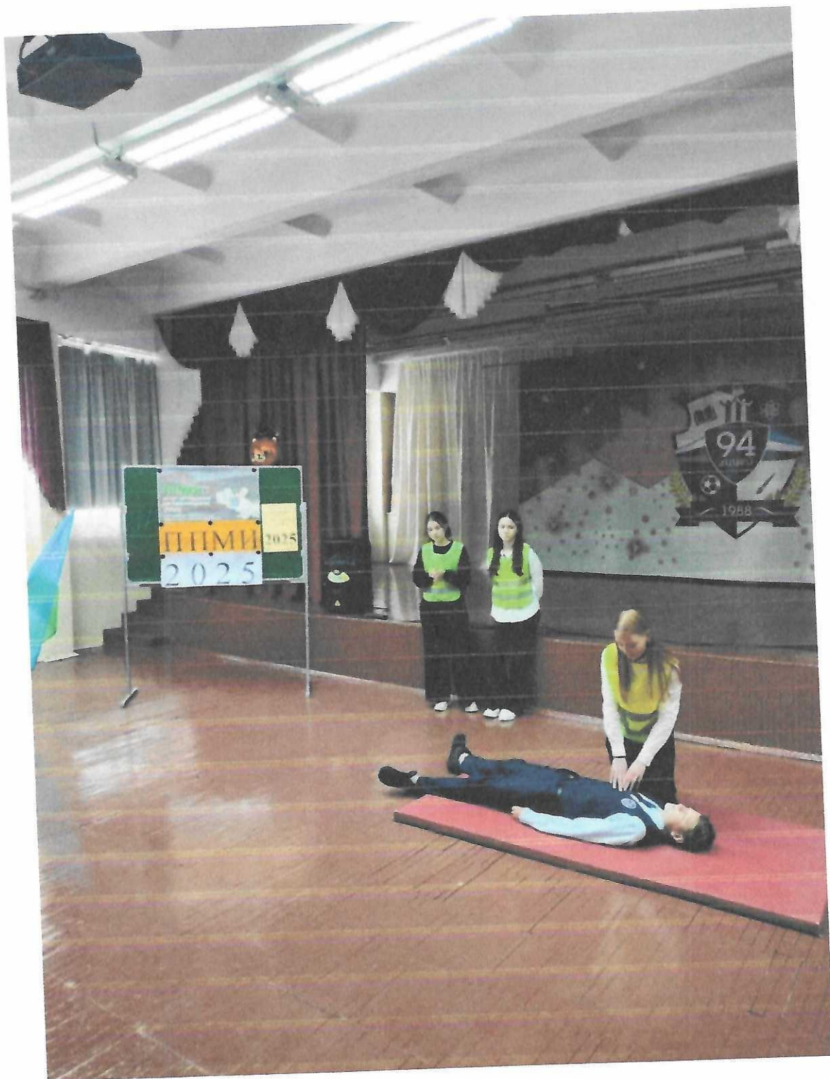
10. Акція «Внимание- дети!» 1 четверть https://vk.com/wall-127992313_12944