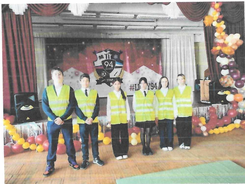
6. Памятка о безопасном поведении на железной дороге в преддверии осенних каникул https://vk.com/wall-127992313_12722